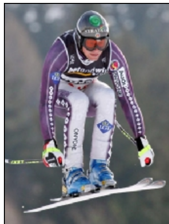
Hoge ISO waarde