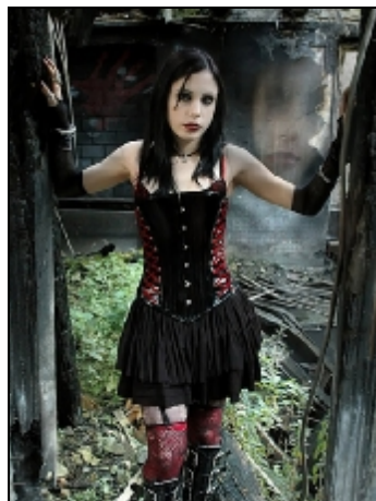
Lage ISO waarde